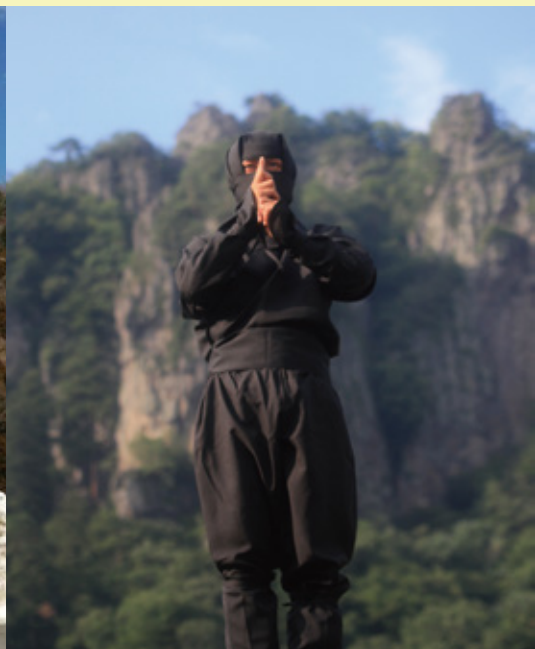
▲岩櫃山を仰ぐ最高のロケーション「密岩神社」では、こんな写真が撮れます