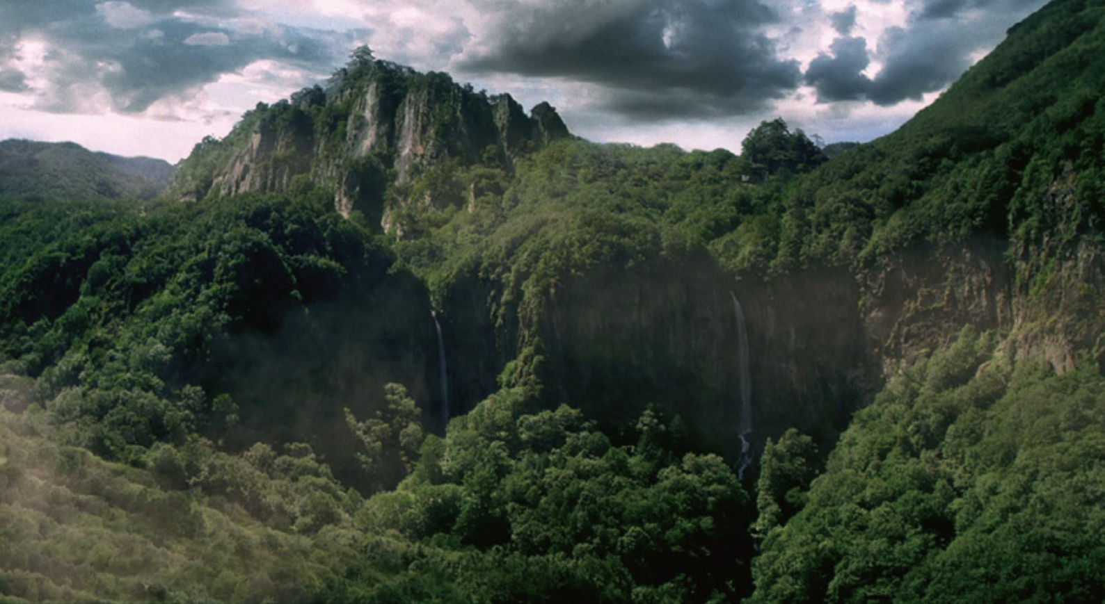
▲大河ドラマ「真田丸」オープニングのタイトルバックにCGで登場する岩櫃山